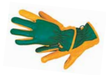
Gartenhandschuhe Garden Clubs