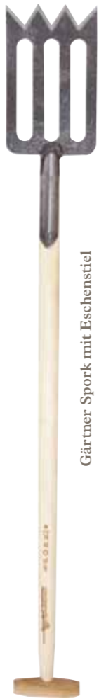
Gärtner Spork mit Eschenstiel